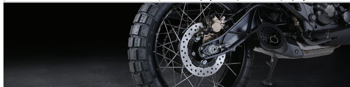
Ενισχυμένο ψαλίδι κράματος αλουμινίου Εξαιρετικής σχεδίασης εξάτμιση